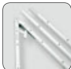
Rahmen aus 3,2/3,2 cm Vierkant-Aluminiumprofil