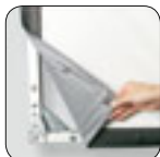
Leinwandfolie mit 5 cm breiter, schwarzer Randverstärkung